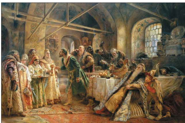
9. К. Е. Маковский. Боярский свадебный пир в XVII веке